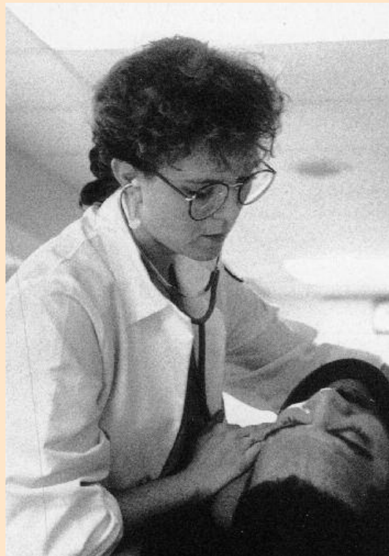
L'assistenza all'Albert Einstein Hospital di Philadelphia (USA), 1991. Foto di Leonard Freed. Dal volume: Dagli archivi dei grandi fotografi. © Libardi & Partners, Roma.

La narrazione è una modalità comunicativa flessibile e mirata, che va di volta in volta adattata al paziente reale e alla situazione reale. Non esistono due narrazioni uguali, neanche quando provengono da una stessa persona.